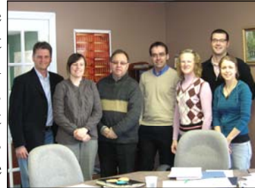
Ire réunion 30 mars 2010

C'est avec fierté que le maire et l'agent de développement ont présenté ce document en assemblée publique le 28 avril dernier. À peine un an depuis la mise en marche du comité, on arrive avec un produit fini, bien illustré et prêt à être utilisé comme guide par les personnes, entreprises et comités soucieux de notre avenir collectif.